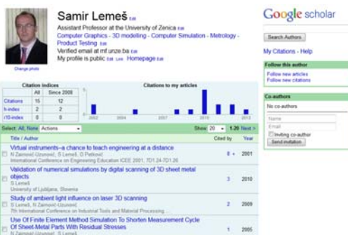
Slika 4. Primjer Google Scholar profila

Ima i neke karakteristike društvene mreže, jer daje mogućnost istraživačima da kreiraju svoj profil, s osnovnim podacima o istraživaču, te mogućnost ažuriranja objavljenih radova. Na slici 4 prikazan je primjer "profila" jednog istraživača, a na slici 5 primjer meta-oznaka koje olakšavaju automatsko pretraživanje i indeksiranje online materijala.