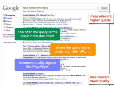
Slika 1. Rangiranje na Google pretraživaču [14]

Ovaj kriterij predstavlja broj web stranica s te domene koje je indeksirao Google i čini polovinu ukupne ocjene. To znači da kvalitet web stranice i njena usklađenost s kriterijima na osnovu kojih Google vrši indeksiranje značajno utječe na rang univerziteta. Na primjer, ako su web stranice siromašne metapodacima, nemaju definisane naslove, alternativne nazive slika, odnosno ne zadovoljavaju neki od preko 200 Google PageRank kriterija, dat će manje rezultata. Na ovaj kriterij značajno utječe i česta pojava da organizacione jedinice univerziteta koriste vlastite domene ( www.fknbih.edu ), umjesto univerzitetske poddomene ( www.mf.unze.ba ), tako da podaci iz tabele ne prikazuju stvarno stanje.